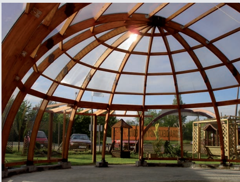
KOPUŁA BASENOWA / SALON WYSTAWOWY – MAYA nr ref. APM000