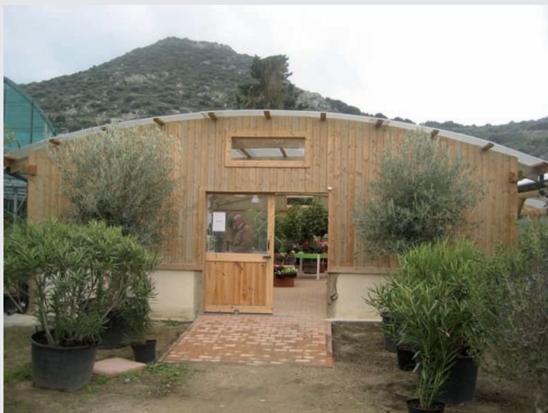
SALON WYSTAWOWY – KORSYKA nr ref.GC000