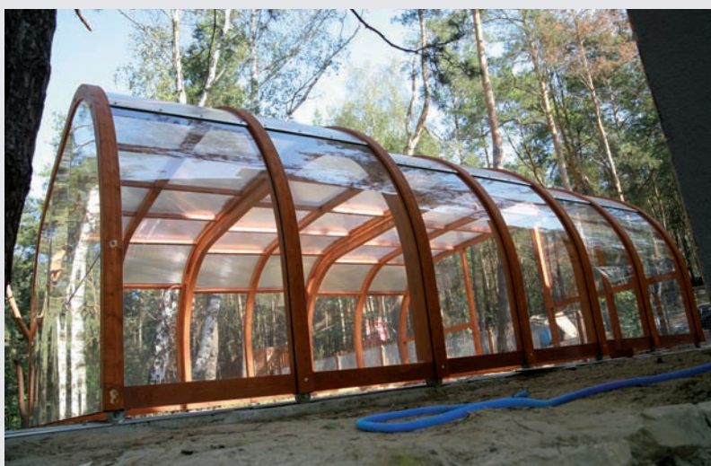
PRZESUWNE ZADASZENIE BASENU – KAYA nr ref. APK000

Otrzymujecie Państwo produkt łączący najwyższą jakość materiałów , funkcjonalność i subtelną estetykę.